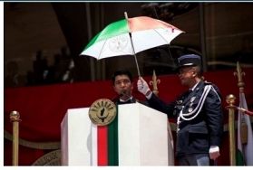
Le nouveau président malgache Andry Rajoelina prend la parole lors de son investiture à Antananarivo, le 19 janvier 2019.

https://www.lemonde.fr/afrique/article/2019/02/18/madagascar-le-nouveau-pouvoir-arrete-des-proches-de-lancien-president_542366_3232.html