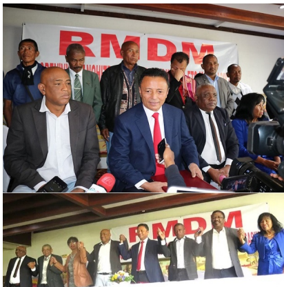
Marc Ravalomanana et ses alliés occasionnels du MRDM, sans base ni idéologie ni projet de société mais uniquement guidés par la haine et la jalousie envers le Président Andry Rajoelina. Certains de ces personnages ont été candidats à l'élection présidentielle de 2018, financièrement aidés par des Russes...

mais Ravalolo s'est fait des idées AVANT les élections qu'il a toutes perdu.