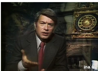
Le 23 mars 1976 sur TF1, Roger Gicquel (1933-2010), journaliste présentateur du journal télévisé de 20 heures annonce l'heure d'été. Il était alors sceptique...

« En France, on n'a pas de pétrole mais on a des idées ». C'est un slogan publicitaire de 1976 sorti durant la crise pétrolière à l'époque. Les prix du brut avaient alors atteint des sommets. Cette phrase a une suite : « notre richesse et notre façon de vivre qui est menacée ». Elle était adressée aux Français qui avaient alors le devoir de sauvegarder leur souveraineté « en faisant la chasse au gaspillage ». Et c'est ainsi que, le 26 mars 1976, la France a commencé à utiliser l'heure d'été (-1h sur Madagascar en mars) et l'heure d'hiver (-2h sur Madagascar en octobre) décidés par le Président Valéry Giscard d'Estaing.