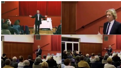
Photos extraites de la vidéo où le conférencier, un Français, dit : "les pays pauvres ont deux solutions: soit ils empruntent pour continuer à payer leurs intérêts, soit ils vendent leurs ressources pour presque rien"

Dette odieuse. Il en existe plusieurs définitions, selon le côté où l'on se situe... A mon sens, c'est la théorie développée par Alexander Sack, en 1927 (oui, déjà), qui est la base la plus simple et la plus proche des réalités qui prévalent toujours de nos jours. Ainsi, selon la doctrine juridique de la dette odieuse théorisée par Alexander Sack, une dette est « odieuse » lorsque deux conditions essentielles sont réunies: