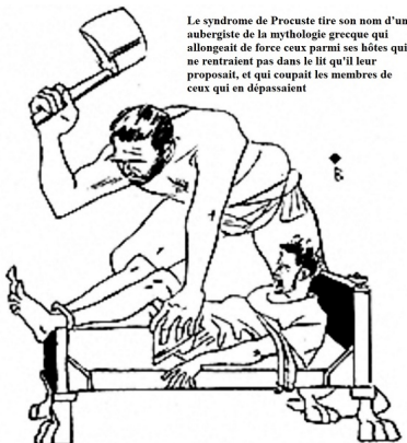
Le syndrome de Procuste tire son nom d'un aubergiste de la mythologie grecque qui allongeait de force ceux parmi ses hôtes qui ne rentraient pas dans le lit qu'il leur proposait, et qui coupait les membres de ceux qui en dépassaient

Le syndrome de Procuste tire son nom d'un aubergiste de la mythologie grecque qui allongeait de force ceux parmi ses hôtes qui ne rentraient pas dans le lit qu'il leur proposait, et qui coupait les membres de ceux qui en dépassaient. Ce mythe illustre parfaitement cette tendance universelle à déformer (ou nier) des faits pour les faire concorder avec une orthodoxie rationnelle ou religieuse.