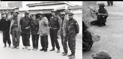
Zanadambo de 2002