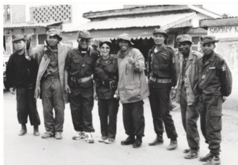
Zanadambo de 2002

dû être maîtrisé par les forces de sécurité après avoir essayé de s'échapper. Amnesty International était alors préoccupée par le fait que l'enquête ait été menée par la police, sans aucune garantie d'indépendance et d'impartialité, par le fait qu'aucun membre des forces de sécurité n'a été suspendu durant le temps de l'enquête et parce qu'aucun témoin, à part les forces de sécurité, ne semble avoir été interrogé. Selon les rapports, l'enquête est toujours ouverte.