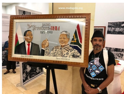
Votre serviteur lors de l'exposition organisée au CCI Ivato, le 17 avril 2019

Nelson Mandela était enfin libre après 27 ans, 6 mois et 6 jours d'emprisonnement.