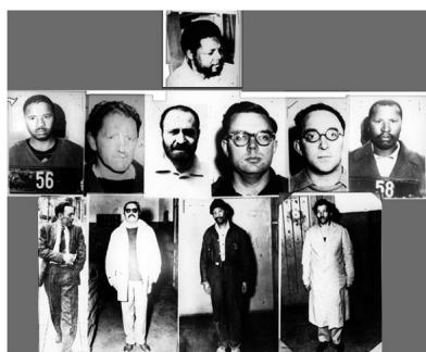
Les accusés du procès de Rivonia. En haut, Nelson Mandela. En bas, à droite, ressemblant à Charlot, Walter Sisulu. Avant lui, Govan Mbeki (en bonnet), père du futur président Thabo Mbeki. Sept de ces accusés seront condamnés à la prison à vie pour sabotage

Le 5 août 1962, Nelson Mandela est arrêté avec l'aide de la CIA américaine. Il faut dire que l'ANC faisait partie des organisations classées comme « terroristes ». Le 9 octobre 1963 commença donc le procès de Rivonia. Malgré la situation ne plaidant pas en sa faveur, ce sera pour Nelson Mandela une occasion de s'exprimer. Voilà ce qu'il a dit lors du procès : « Toute ma vie, je me suis consacré à la lutte pour le peuple africain. J'ai chéri l'idéal d'une société libre et démocratique dans laquelle toutes les personnes vivraient ensemble en harmonie. C'est un idéal pour lequel j'espère vivre et agir. Mais, si besoin est, c'est un idéal pour lequel je suis prêt à mourir ».