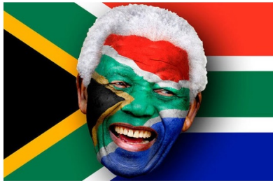
Nelson Rolihlahla « Madiba » Mandela (1918-2013)

En Afrique du Sud, sous le régime de l'apartheid, le procès de Rivonia (nom d'une commune située dans la banlieue de Johannesburg), a eu lieu du 9 octobre 1963 au 12 juin 1964 devant la haute cour du Transvaal, région située alors dans le Nord-est de l'Afrique du Sud. Etaient mis en cause une dizaine de dirigeants de l'Umkhonto we Sizwe ou MK, la branche armée de l'ANC (Congrès national africain) pour sabotage, destruction de biens (tous deux passibles de la peine capitale), violation de la loi sur l'interdiction du communisme. Parmi eux, Nelson Mandela Nelson Mandela, qui purgeait déjà une peine de prison de cinq ans pour avoir incité des travailleurs à faire grève et pour avoir quitté le pays illégalement.