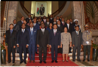
Dernier gouvernement de "combat" du Premier ministre Olivier Mahafaly Solonandrasana, nommé le 10 avril 2016 par le Président