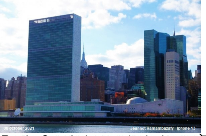
Jeannot Raimbaza - iPhone 13