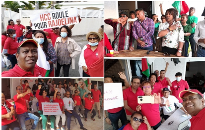
La famille des malgaches planqués à l'île de La Réunion qui comptent, sans doute, revenir en Filanjana et en Salaka, tout rétrogrades qu'ils sont

Un coup de marteau. Jamais, dans l'histoire bientôt centenaire du Parti communiste français, une direction n'a été mise à terre (...) ».