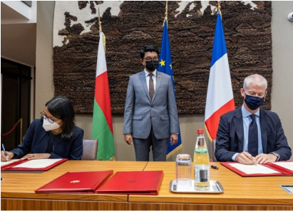
Palais d'Etat à Iavoloha, le 20 septembre 2021, le ministre malgache de l'Economie et des Finances Rindra Rabarinirinarison, et le ministre français en charge du Commerce extérieur, Franck Riester, ont signé un protocole portant financement de ce projet. Ce