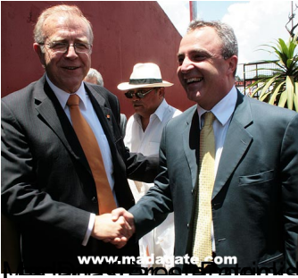
Président de l'Union des Télécommunications (U.T.) Jean Luc Bohé d'Orange