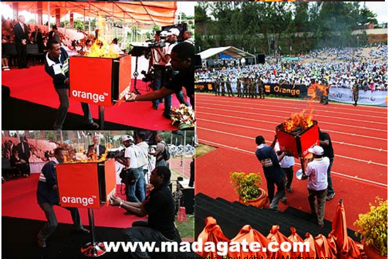
Une vraie flamme symbolisant l'arrivée de l'internet à Haut débit sur Madagascar