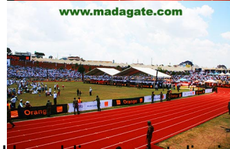
Un public sage et discipliné car la sécurité était renforcée