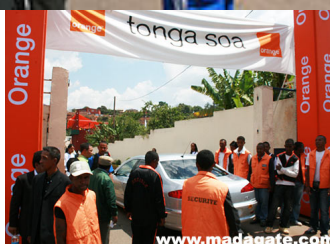
Entrée du stade aux couleurs orange