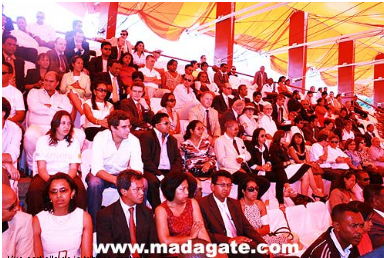
Vue partielle de la tribune centrale