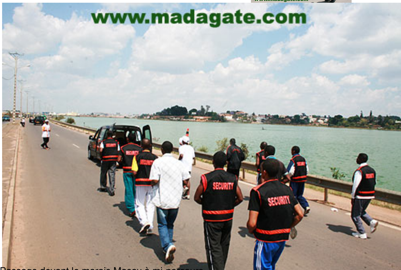
Passage devant le marais Masay à mi-parcours