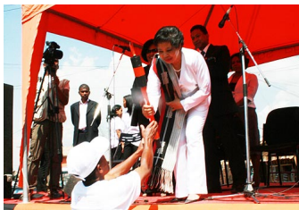
Relais au premier coureur pour le stade d'Alarobia