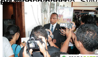
Le passage des deux responsables du BIT Océan Indien au stand de la COPEMA