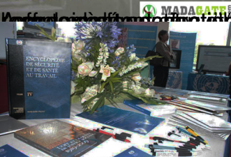
Des ouvrages spécialisés sur la législation du monde du travail

la stratégie d'appui de l'OIT au monde du travail : Evaluation des compétences des