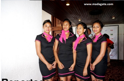
Reportage de Jeannot Ramambazafy et Harilala Randrianarison