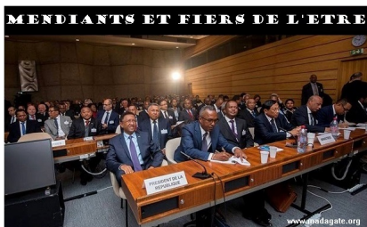
Unesco Paris, 1-2 décembre 2016. Au premier plan, les 7 mendians de haut niveau, au nom du peuple malgache qui paiera toutes les dettes qu'ils auront contractées, sur plusieurs générations. L'Histoire a le devoir de ne pas effacer cette étape de la mémoire collective.

amin'ny mpamatsy vola toa ny nahazatra, hatramin'izay, rehefa miverina ny delegasiona mafonja (ary navoaka amin'ny gazety rehetra fa « nahomby » ny dia ) nefa ny vola tsy eo am-pelan-tànana akory...) fa avy hatrany dia fampiarana. Aiza fotsiny, ohatra ireo hoe vola amina miliara dôlara nangatahin-dry Rajaonarimampianina sy Rivo Rakotovao tao Paris, ny 1 sy 2 Desambra 2016 ? Nisy tokoa ve dia natao inona ?