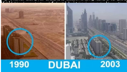
Dubaï est la ville des changements rapides.

https://www.worldometers.info/world-population/madagascar-population/