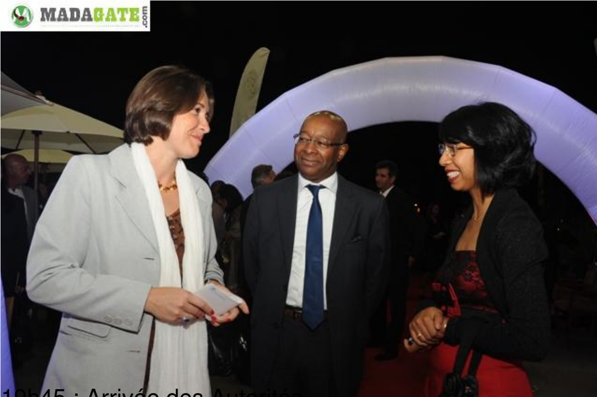
19h45 : Arrivée des Autorités