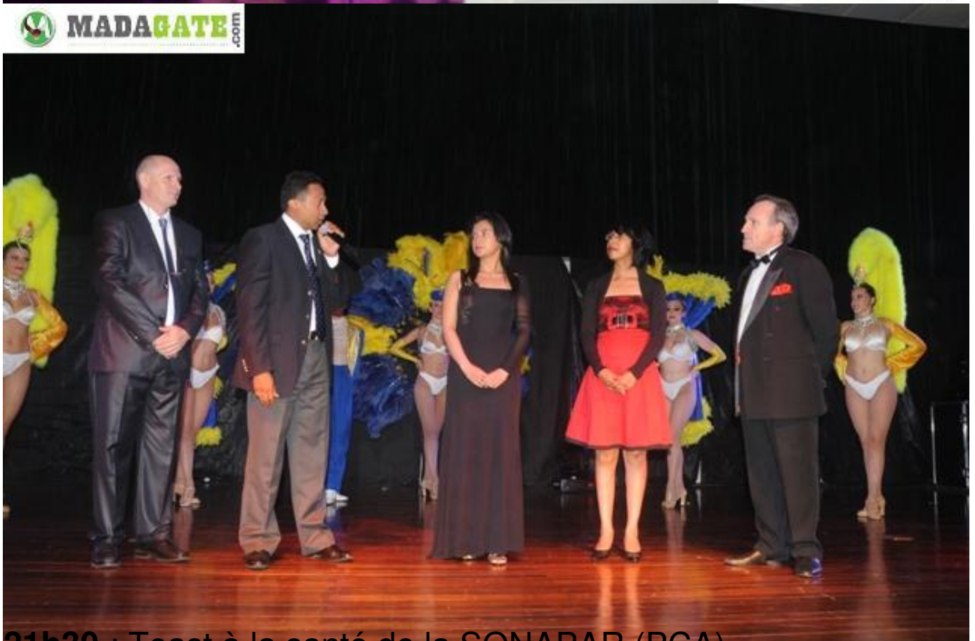
21h30 : Toast à la santé de la SONAPAR (PCA)