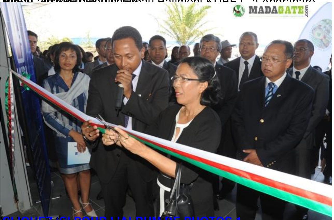
CLIQUEZ ICI POUR LA LUNE DE PHOTOS 1 Visite du bâtiment par les autorités