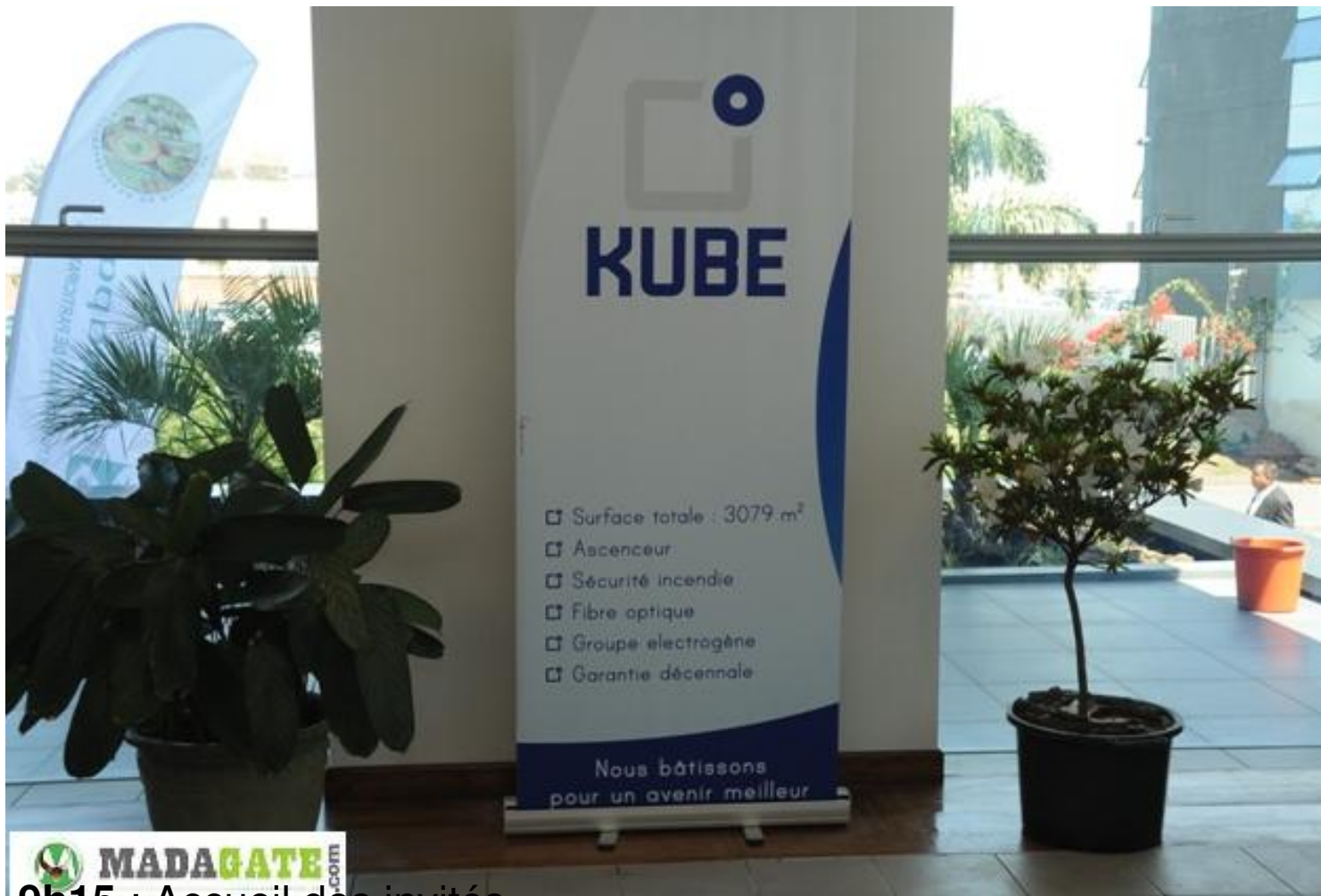
9h15 : Accueil des invités