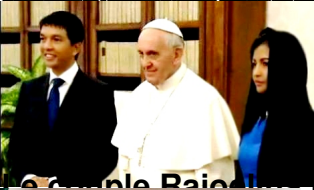
Le couple Rajoelina reçu par le Pape François au Vatican