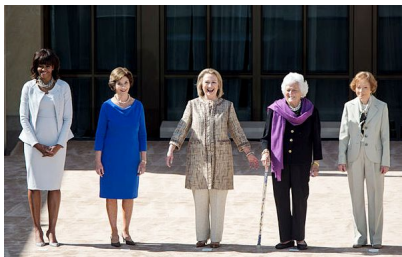
Photo de cinq autres Premières des Etats-Unis, en avril 2013. De gauche à droite : Lady Michelle Obama, Laura Bush, Hillary Clinton, Barbara Bush, Rosalynn

En général, il s'agit de l'épouse d'un président élu. On pense que son origine est anglaise, le terme « First Lady » désignant, originellement, la femme du président des Etats-Unis d'Amérique. Par la suite, il a été repris et traduit dans d'autres langues, mais pas en malgache. C'est vrai. On a toujours dit femme du président ( « Vadin'ny filoha » ) mais jamais Première Dame (« Vehivavy voalohany » ).