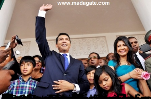
Ministre de l'Énergie et de l'Électricité, Hery Rajaonarimandriana, lors d'une cérémonie