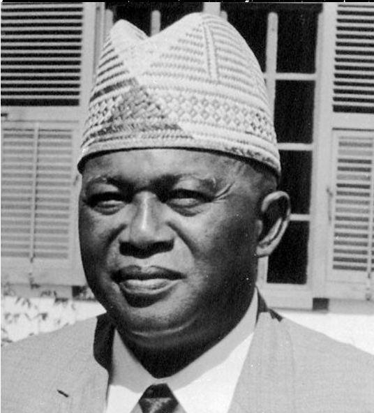
Dadabe Tsiranana tel que je l'ai toujours vu