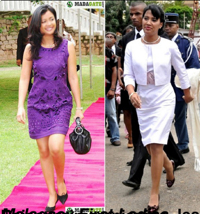
Madagascar First ladies, les deux cadettes : Mialy Rajoelina et Voahangy