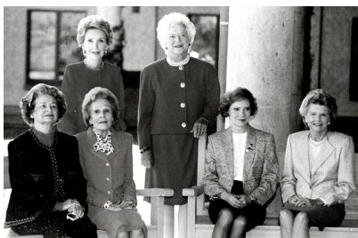
Photo de six Premières dames des États-Unis en novembre 1991. Assises, de gauche à droite : Lady Bird Johnson, Pat Nixon, Rosalynn Carter, et Betty Ford. Debout, de gauche à droite : Nancy Reagan et Barbara Bush