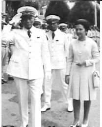
Thérèse Risoaolainaina et Zafy Albert Risoaolainaina - Première épouse de l'ancien Président de la République, l'ancien