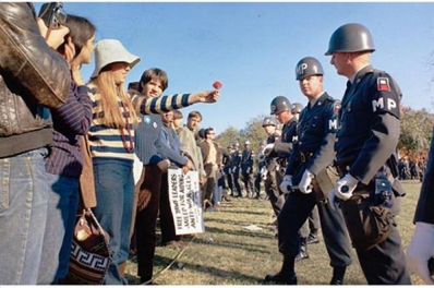
Human beings possess a variety of sometimes contradictory desires. Democracy is no different, and it is important to recognize that many of these tensions, even paradoxes, are present in every democratic society. Les êtres humains possèdent des désirs parfois contradictoires. La démocratie n'est pas différente, et il est important de reconnaître que beaucoup de ces tensions, voire des paradoxes, sont présents dans toutes les sociétés démocratiques.

"The strongest democracies flourish from frequent and lively debate, but they endure when people of every background and belief find a way to set aside smaller differences in service of a greater purpose." "La démocratie la plus forte s'épanouit des débats fréquents et animés, mais elle s'enrichit quand les gens vivent dans des contextes différents et expriment des opinions différentes, trouvent un moyen de mettre de côté leurs différences au service d'un objectif plus important." - Barack Obama, 44th U.S. President