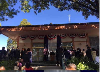
Villa Philadelphia - Antananarivo