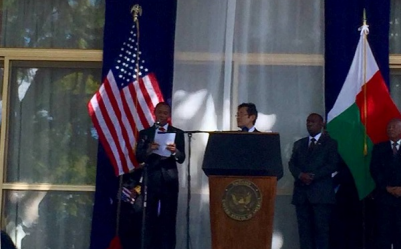
MEMORIAL DAY EXHIBIT