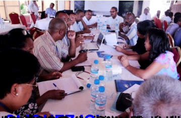
INDEPENDENCE DAY 2016