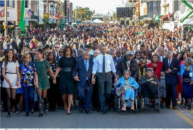
The rule of law protects fundamental political, social, and economic rights and defends citizens from the threats of both tyranny and lawlessness. Democratic governments exercise authority by way of the law and are themselves subject to the law in consequence. L'état de droit protège les droits politiques, sociaux et économiques fondamentaux et défend les citoyens contre les menaces de la tyrannie et l'anarchie. Les gouvernements démocratiques exercent l'autorité par le biais de la loi et sont eux-mêmes soumis à la loi.

"The law is not the private property of lawyers, nor is justice the exclusive province of judges and juries... true justice is not a matter of courts and law books, but of a commitment in each of U.S. to liberty and mutual respect." "La loi n'est pas une propriété privée des avocats et la justice n'est pas du ressort exclusif des juges et des jurés. Au fond, la vraie justice n'est pas une question de tribunal et de livres de droit, mais l'engagement de chacun de nous pour la liberté et le respect mutuel." - Jimmy Carter, 36th U.S. President