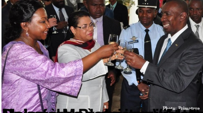
Le ministre malgache des Affaires étrangères, Andriamandiso Andriamanelo, lors de la Journée de l'ONU 2016 à New York.