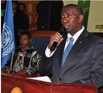
Le ministre malgache des Affaires étrangères, Andriamandiso Andriamanelo, lors de la Journée de l'ONU 2016 à New York.