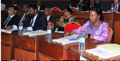
Le ministre malgache des Affaires étrangères, Andriamandiso Andriamanelo, lors de la Journée de l'ONU 2016 à New York.