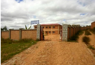
Le 22 juillet 2017, la cérémonie de la pose de la première pierre de l'Orphelinat