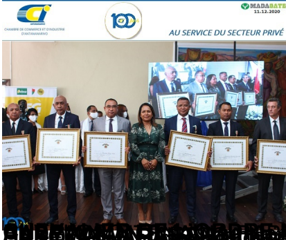
SALEZIANI STRAIPATI INTERNATIONAL Mauricea