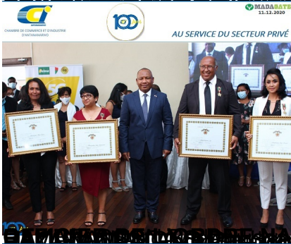
LA VARIATION EN TUNISIE INTERNATIONAL Ana Alain (absent sur la photo)