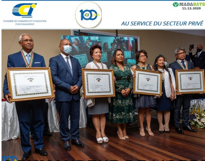
BOITARDIENS DU FORD INTERNATIONAL (decedé)