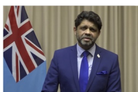
M. Aiyaz Sayed-Khaiyum, Premier ministre par intérim des Fidji

S'exprimant depuis un pays insulaire qui a été frappé par 14 cyclones depuis 2016, M. Aiyaz Sayed-Khaiyum