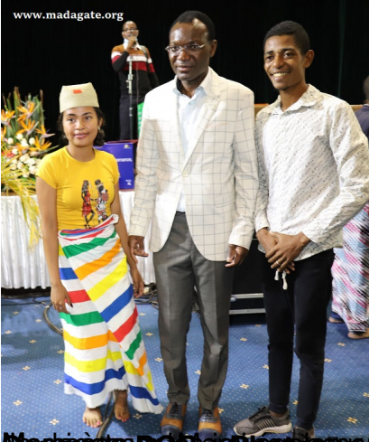
Madagascar. Observatoire de la Jeunesse de l'Organisation des Nations Unies pour le Développement