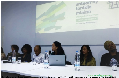
antson'ny tontolo miaina Zone Zitél (à côté du magasin Bébé à bord) du 20 mai au 5 juin Horaires : du lundi au samedi de 11h à 18h30 Dimanche, lundi de pentecôte (29 mai) de 10h à 13h Tel : +261 32 94 099 57 www.madagatc.org