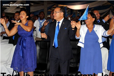
Fait le mouvement! Le Premier ministre en tête, en bleu !