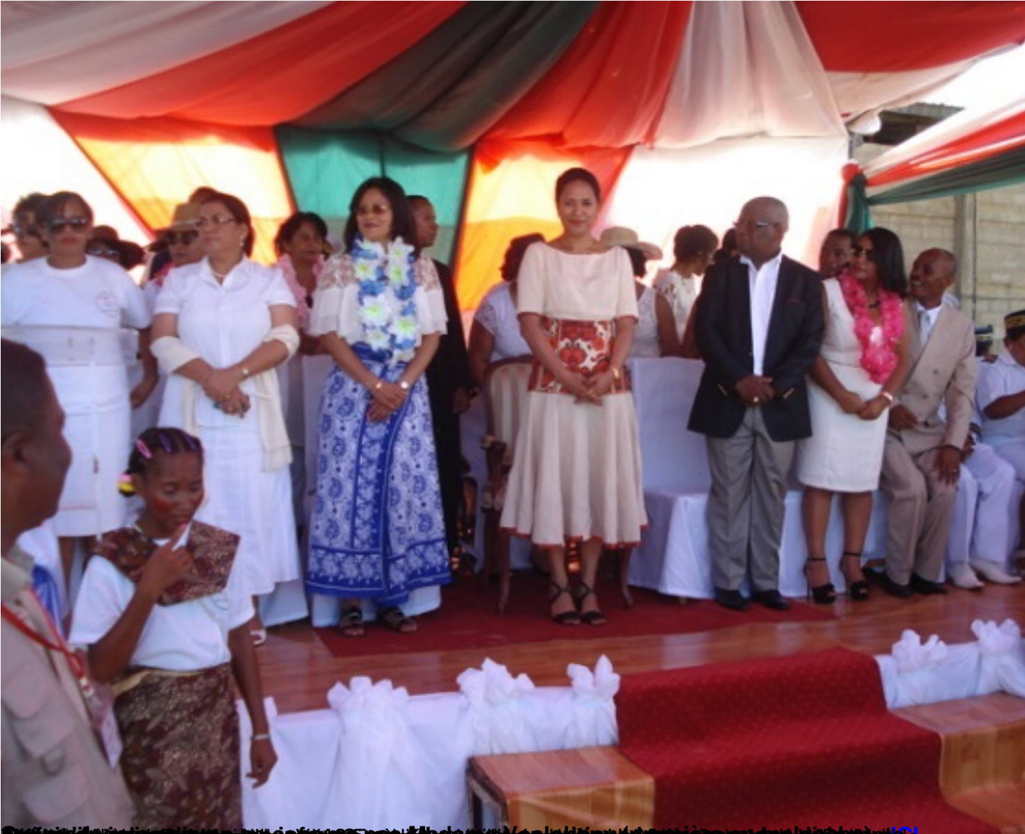
Quelques photos de la cérémonie pour l'adoption de la loi relative à la détermination de la nationalité