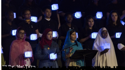
Le 26 septembre 2015 à New York, la dirigeante Malgache Kiroro, ambassadrice des Nations Unies (ONU) et résidente à New