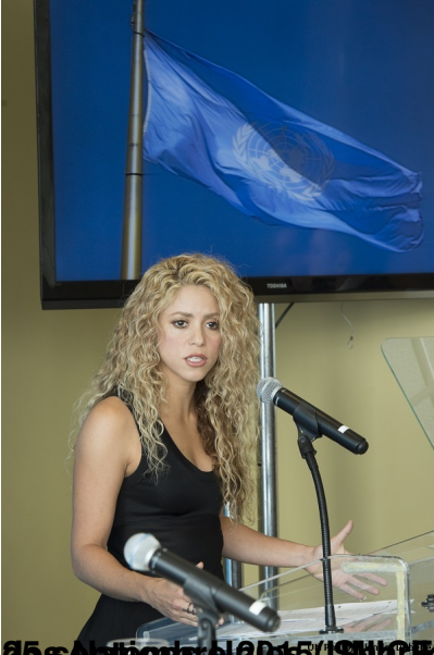
28 septembre 2015 - Shakira, chanteuse colombienne et Ambassadrice de bonne volonté