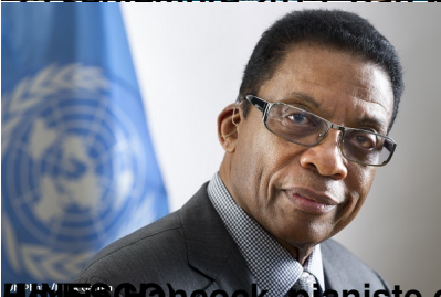
28 septembre 2015 - Herbie Hancock, pianiste de jazz et Ambassadeur de bonne volonté des Nations Unies