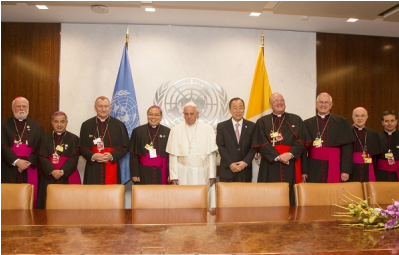
28 septembre 2015 - Les cardinaux de la délégation pontificale posant avec le Pape et le