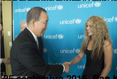
28 septembre 2015 - Ban Ki-moon saluant Shakira