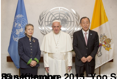
Le Secrétaire général (à gauche) et le Président de la République (à droite) lors d'une réunion à la