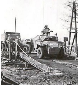
Véhicules du 59 e régiment d'artillerie royal traversant un pont Bailey à Dreierwalde, le 6-8 avril 1945.