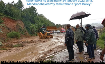
Moramanga RN2. Deviation efa azo andehana nanomboka ny alatsinainy 24 janoary 2022 alina. Mandrapahavitan'ny fametrahana "pont Bailey"