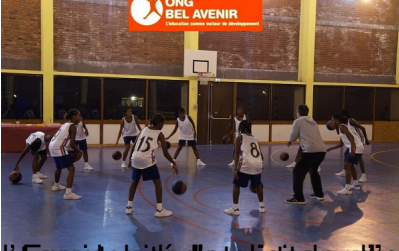
été initiés à de nombreuses activités sportives et culturelles. Les jeunes sportifs ont