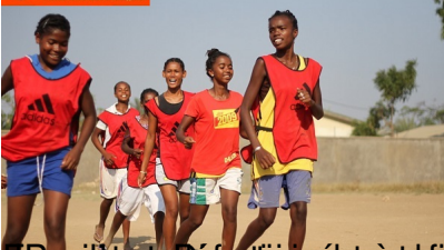
Les jeunes sportifs ont été récompensés par un grand nombre de médailles et ont