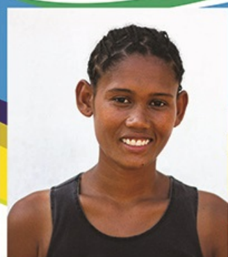
Malala Défense gauche