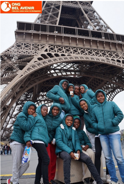
Après avoir gagné plusieurs médailles à la compétition de la Tour Eiffel, un