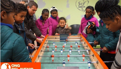
participé à de nombreuses activités sportives et culturelles. Les jeunes sportifs ont