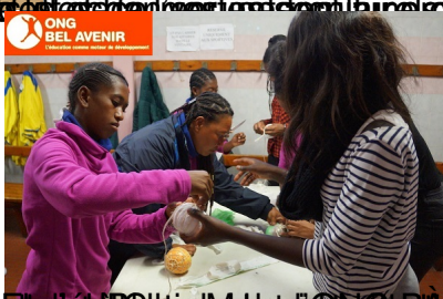
à l'occasion de la tournée européenne de l'école de sport. Les jeunes sportifs ont