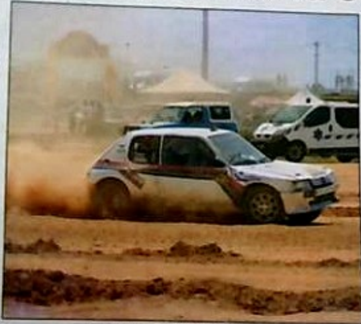
Déjà des compétitions annulées...

D e sources concordantes, il semble que parmi les têtes dirigeantes, à prendre au conditionnel, certains se seraient empêtrés dans un immense scandale financier. A vrai dire, des zones d'ombre entourent la subvention financière de la part de la Fédération internationale (FIA), destinée à promouvoir cette discipline au niveau national. Au fil des années, quelques clubs ont commencé à s'interroger et après avoir demandé des comptes, l'équipe dirigeante a eu du mal à s'expliquer. Cela a entraîné le mécontentement des clubs affiliés qui craignent maintenant une saison blanche.