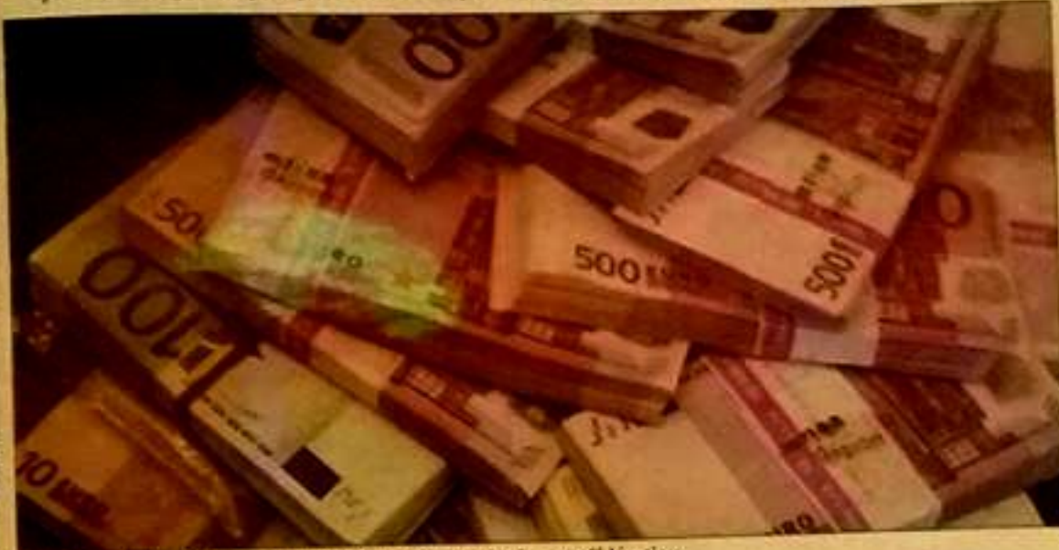
Plusieurs milliers d'euros seraient détournés au sein de cette fédération.

Un procès pénal est actuellement en cours à l'encontre d'un président d'une fédération sportive. Pour ne pas empiéter l'enquête au niveau de l'instruction et par respect de la présomption d'innocence, ni le nom de la fédération, ni le nom de la personne prévenue ne seront cités. Ce que l'on peut affirmer jusqu'ici c'est que plusieurs membres de cette association sportive d'erravegure ont porté plainte contre leur président pour détournement d'une importante somme en devise.