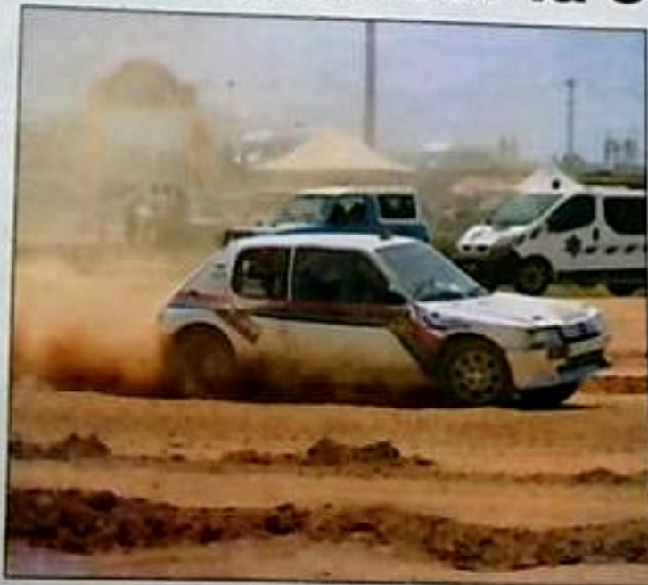
Déjà des compétitions annulées...

D e sources concordantes, il semble que parmi les têtes dirigeantes, à prendre au conditionnel, certains se seraient empêtrés dans un immense scandale financier. A vrai dire, des zones d'ombre entourent la subvention financière de la part de la Fédération internationale (FIA), destinée à promouvoir cette discipline au niveau national. Au fil des années, quelques clubs ont commencé à s'interroger et après avoir demandé des comptes, l'équipe dirigeante a eu du mal à s'expliquer. Cela a entraîné le mécontentement des clubs affiliés qui craignent maintenant une saison blanche.